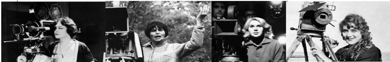
HAKUNA MATATA (El Rey León. 1994)